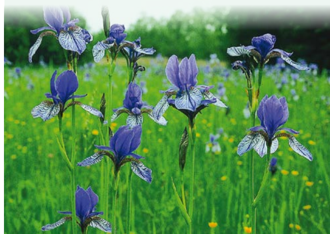
Fioritura di Iris sibirica nei prati di Abis. 1996