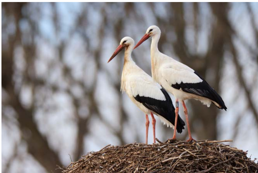
Due esemplari di cicogne presenti nell'Oasi. Sotto, gli ibis eremita, specie ritenuta in pericolo dall'IUCN

L'Oasi accoglie anche la più importante colonia italiana di ibis eremita , specie considerata a rischio di estinzione, e ospita