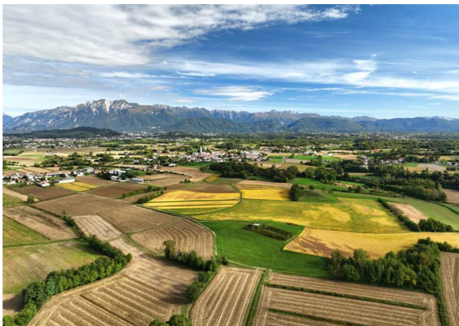
Uno scorcio del Friuli collinare