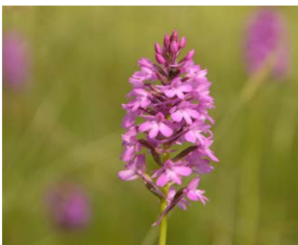
In alto: " Ophrys holosericea "; qui sopra " Anacamptis pyramidalis "

Nus tocje a nô, par podê gjoldi di chestis maraveis tal timp, di tignî cont i prâts che a dan di vivi a plui di cualchidun, intal mieç di chei fros plens di vite.