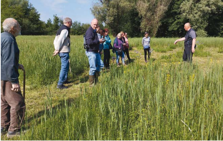
Una visita guidata a Fontana Abisso nell'ambito dell'iniziativa "Sot dai Voi", maggio 2025

tutta l'area. Rivedere un luogo frequentato ed amato come qualcosa di prezioso dopo anni ed anni di completo abbandono è stato per lui un vero e proprio shock che descrive in questi termini: "non c'era più nulla, né insetti, né flora, né fauna".