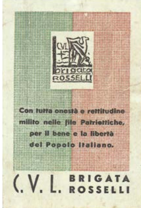
Tessera individuale della Brigata Rosselli